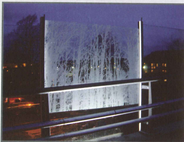
Bullerskärmens fyllning t.ex glas kan förses med tryckt mönster, motiv eller dekorränder efter önskemål. Här är ett antal glas försedda med tryckta motiv som punktbelyses på kvällen.