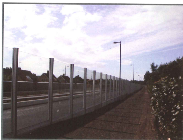
Betongsockel kan användas vid höjdskillnader.